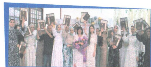
Выпускники ПОАНО «Медицинский колледж» г.Хасавюрт работают во многих городах России: Москва, Санкт-Петербург, Кисловодске, Тюмене. В качестве медицинских работников принимают участие в военных действиях на Украине